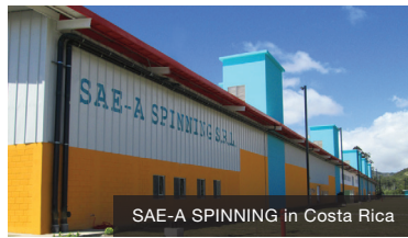
SAE-A SPINNING in Costa Rica