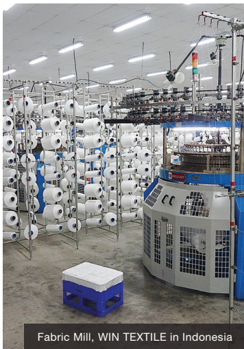
Fabric Mill, WIN TEXTILE in Indonesia