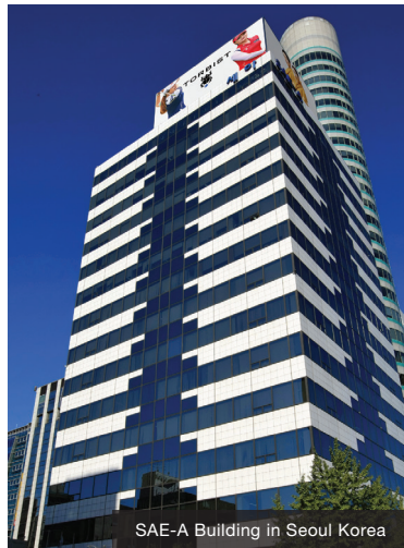
SAE-A Building in Seoul Korea