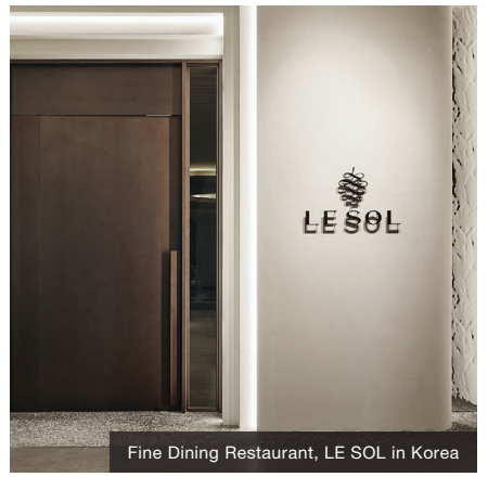
Fine Dining Restaurant, LE SOL in Korea