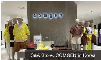
S&A Store, COMGEN in Korea