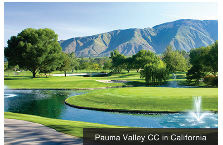
Pauma Valley CC in California